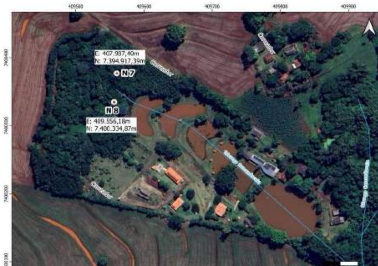
Croqui Nascente 8: Córrego Camanducaia

Coordenadas da nascente UTM: E: 409.556,18m e N: 7.400.334,87m