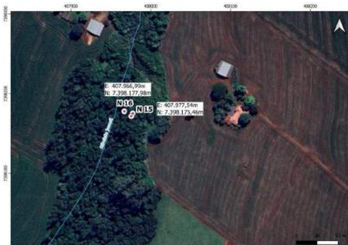
Croqui Nascente 16: Ribeirão Jacanã - nascente 2

Coordenadas da nascente UTM: E: 407.966,99m e N: 7.398.177,98m