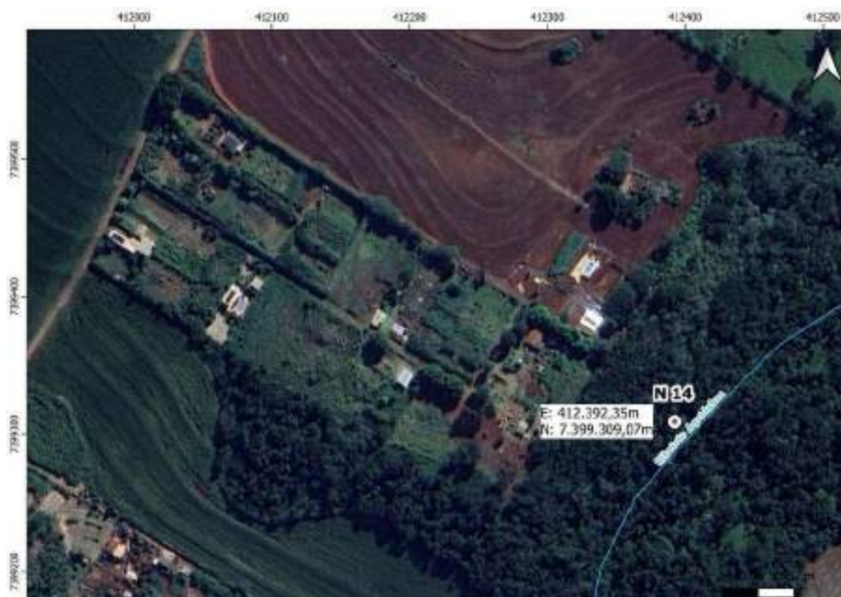
Croqui Nascente 14: Nascente no Observatório Astronômico

Coordenadas da nascente UTM: E: 412.392,35m e N: 7.399.309,07m