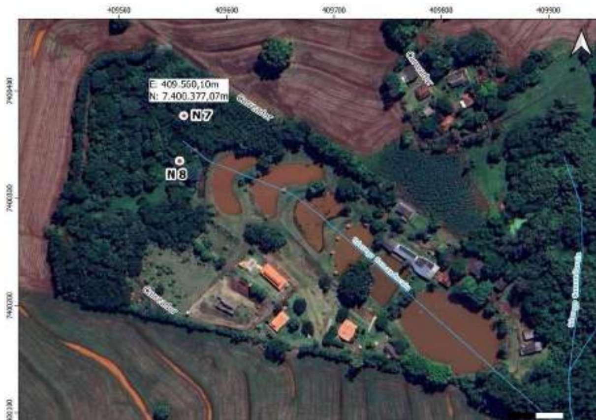
Croqui Nascente 7: Córrego Camanducaia

Coordenadas da nascente UTM: E: 409.560,10m e N: 7.400.377,07m