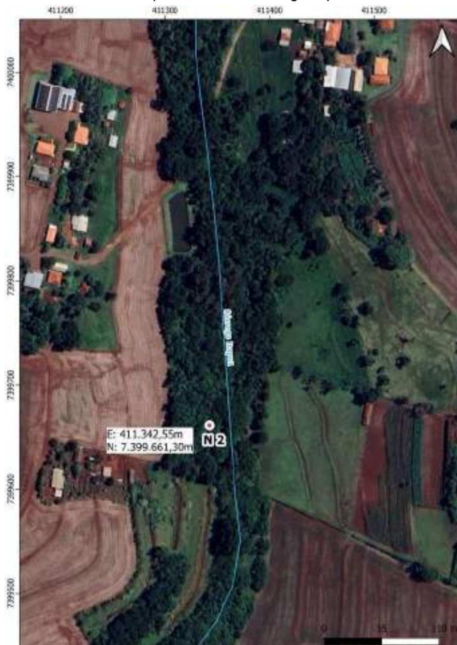
Croqui Nascente 2: Córrego Itapuá

Coordenadas da nascente UTM: E: 411.342,55m e N: 7.399.661,30m