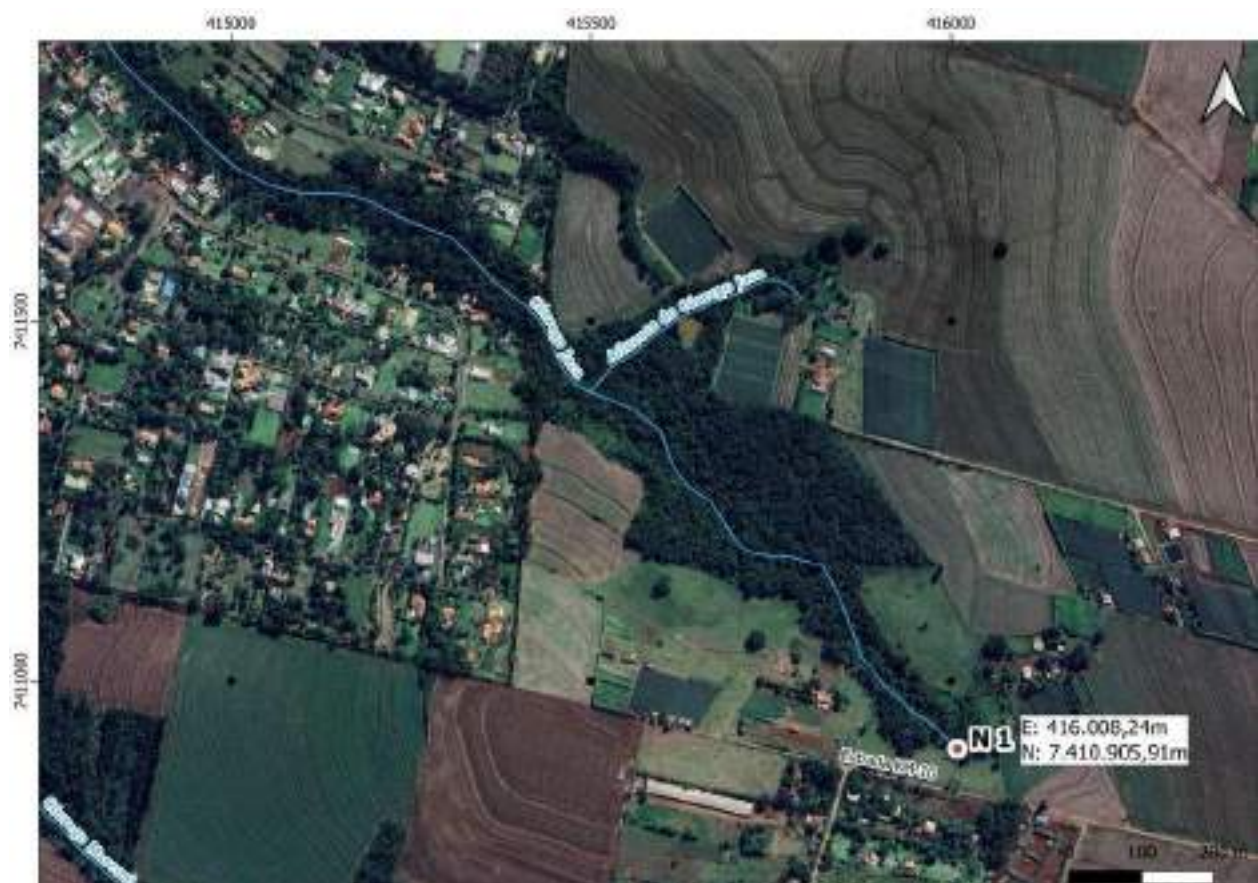
Croqui Nascente 1: Córrego Jaca

Coordenadas da nascente: E: 416.008,24m e N: 7.410.905,91m