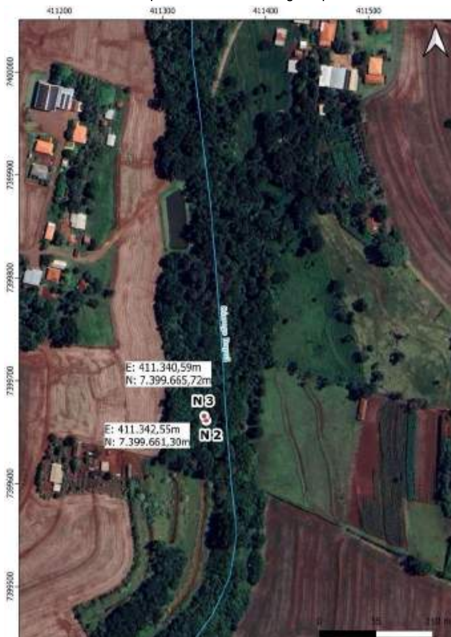
Croqui Nascente 3: Córrego Itapuá

Coordenadas da nascente UTM: E: 411.340,59m e N: 7.399.665,72m