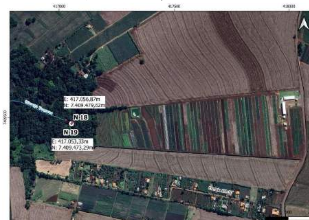
Croqui Nascente 19: Córrego Uvarana - nascente 2

Coordenadas da nascente UTM: E: 417.053,33m e N: 7.409.473,29m