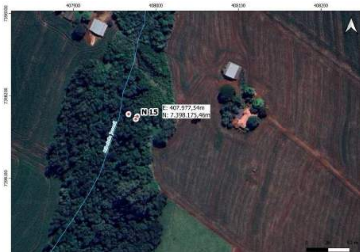
Croqui Nascente 15: Ribeirão Jacanã - nascente 1

Coordenadas da nascente UTM: E: 407.977,54m e N: 7.398.175,46m