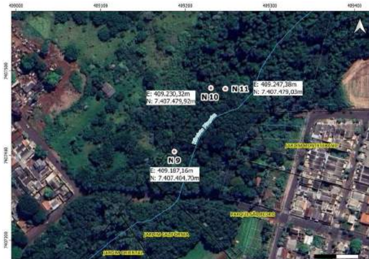
Croqui Nascente 11: Nascentes no Ribeirão Pinguim

Coordenadas da nascente UTM: E: 409.247,38m e N: 7.407.479,03m