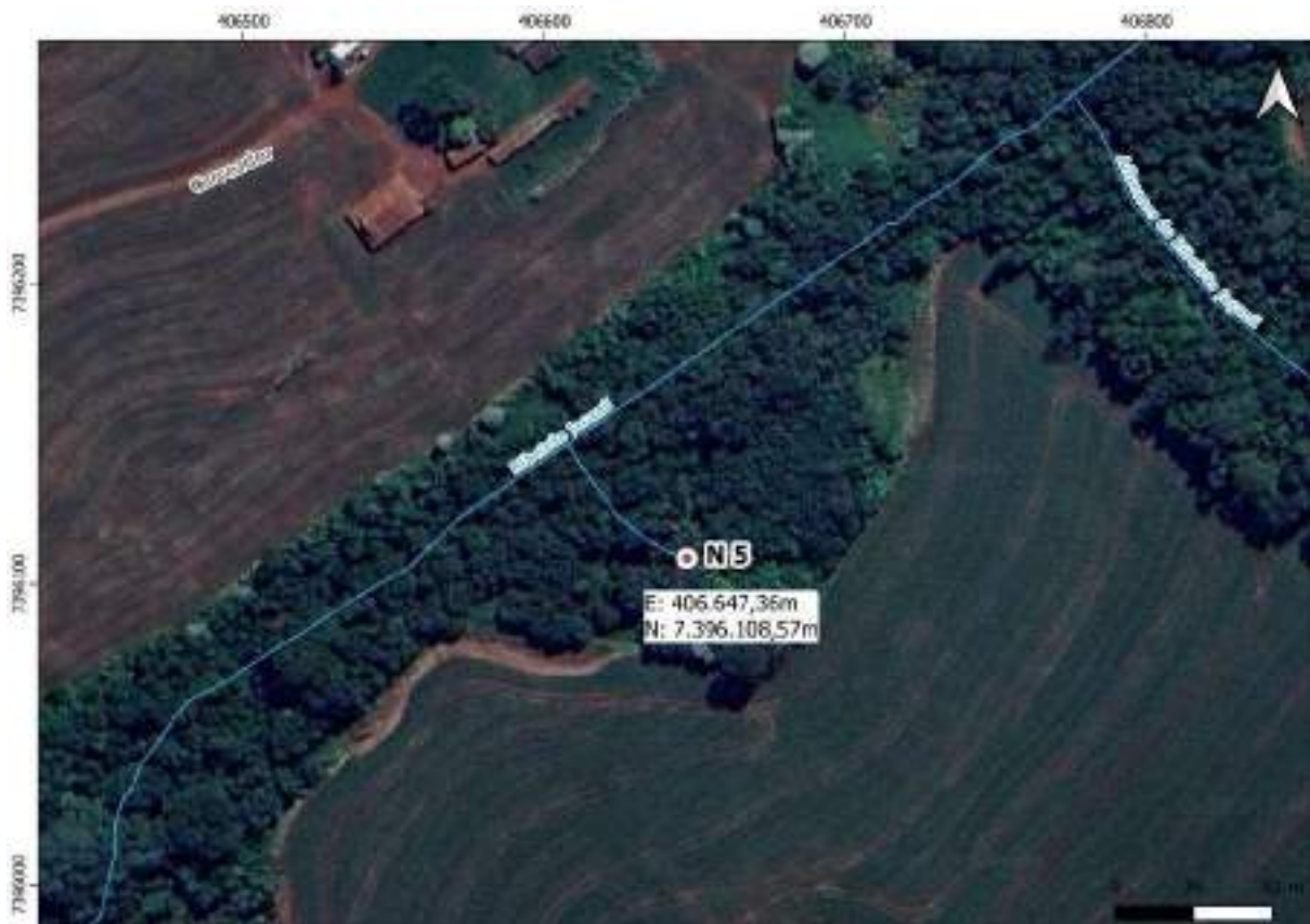
Croqui Nascente 5: Afluente do Ribeirão Jaçanã

Coordenadas da nascente UTM: E: 406.647,36m e N: 7.396.108,57m