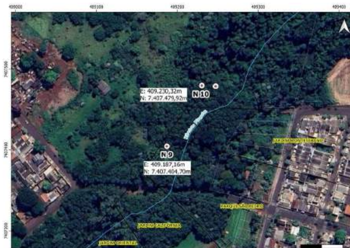
Croqui Nascente 10: Nascentes no Ribeirão Pinguim

Coordenadas da nascente UTM: E: 409.230,32m e N: 7.407.479,92m