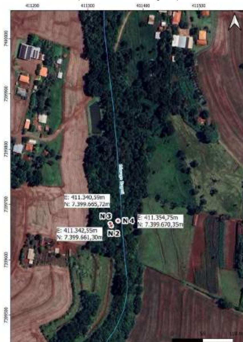
Croqui Nascente 4: Córrego Itapuá

Coordenadas da nascente UTM: E: 411.354,75m e N: 7.399.670,35m