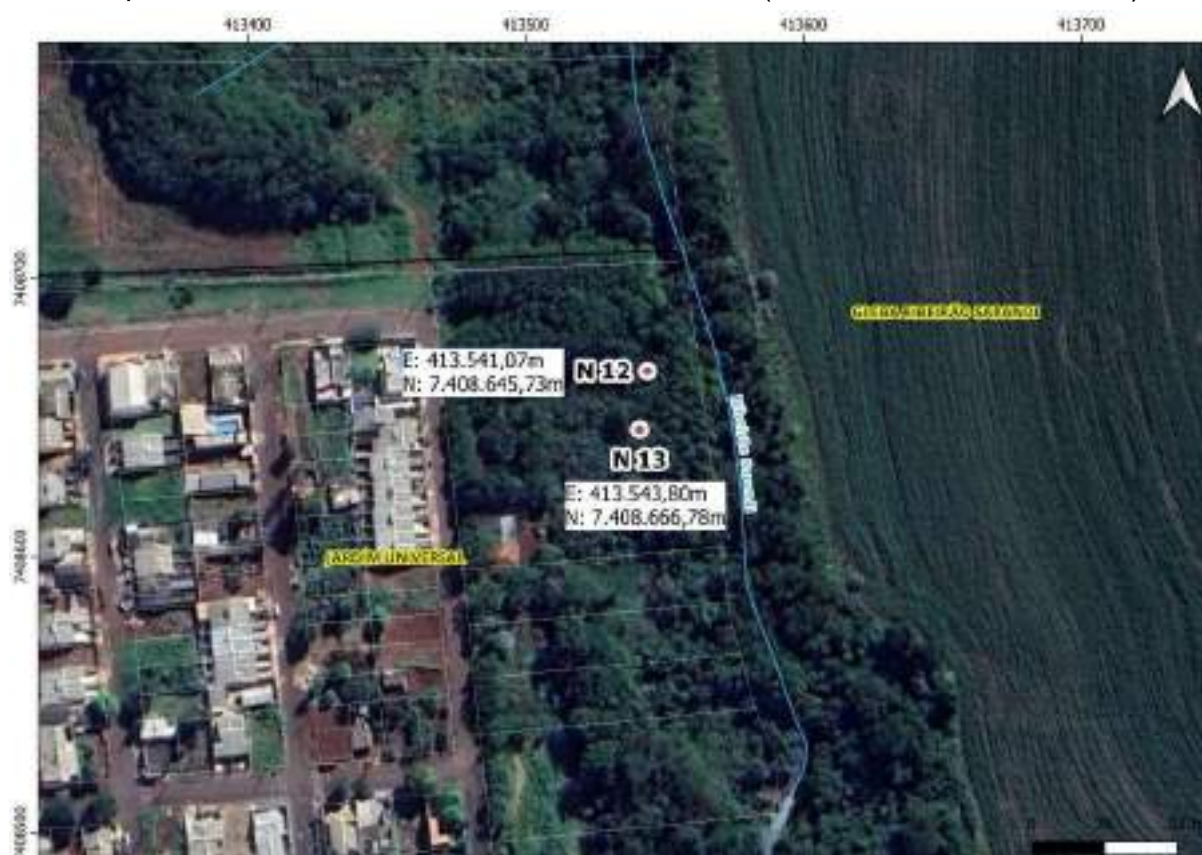
Croqui Nascente 13: Afluente do Ribeirão Sarandi (atrás do Jardim Universal)

Coordenadas da nascente UTM: E: 413.543,80m e N: 7.408.666,78m