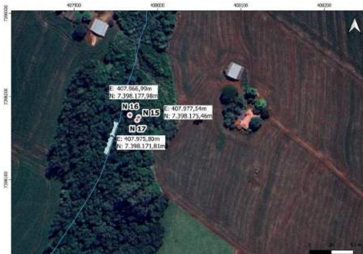
Croqui Nascente 17: Ribeirão Jacanã - nascente 3

Coordenadas da nascente UTM: E: 407.975,80m e N: 7.398.171,81m